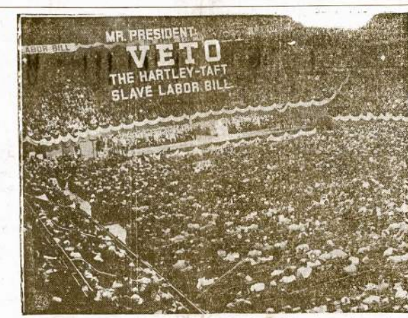
Masinis mitingas New Yorko Madison Square Gardenė. Čia po tuo pačiu parašu—Už Veto—dvejoseose didinguose mitinguose demonstravo CIO ir AFL unijistai

Norėdami atbauginti valdžios tarnautojus nuo dalyvavimo Wallace'o mitinge, Thomas ir Rankinas, "ne-amerikinio komiteto" vadai, paskelbė, kad SCHW