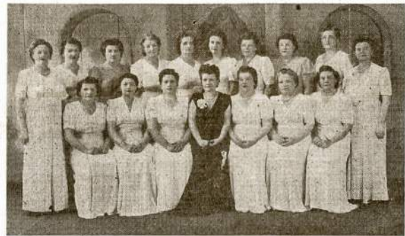
Ciceros Motery Choras, vadovybėj D. Yuden