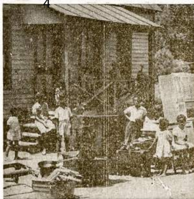
Streikuojajančių Reynolds Tobacco kompanijos darbininkų šeima išmesta iš buto į gatvę. Mat, stambieji namų savininkai gelbėjo kiek galėdami kompanijai sulaužyti streiką ir amžinai pažeisti CIO uniją. Bet darbininkai streiką laimėjo nežiurint kompanijos ir visos buržuazijos pasiojimų pavergti juos.

WASHINGTONAS. — Americans for Democratic Action (ADA), liberaliai-demokratinė organizacija, prie kurios priklauso Eleanor Roosevelt, Hendersonas, Ickes ir visa eilė kitų Roosevelt bendradarbių, reikalauja iš Trumano vetuoti Taft-Hartley planą.