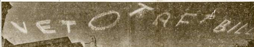
Vetuoti Trumano Bilių—parašas New Yorko padangėje, parašytas orlaivio chemiškais baltais garais. Tą reklamos būdą seniai vartojo komercinės firmos, dabar tą vartoja unijos,—vartojo šio per visą kraštą plintančiam šūkiui išskelti.

Vetuoti Tafto Bilių!— Sukis, Kuris Aidi Visoje Salyje