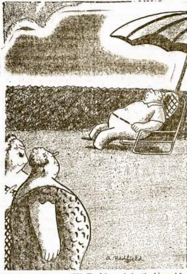
Fabrikanto žmona: "Žiūrėk, kūna, kaip tie blaurybės unijos atstovai nuvargino mano vyrėlį, atsisėdęs užmiglo!"