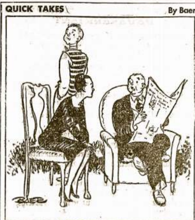
"After all, there is no way of knowing that studying his romance languages to the accompaniment of the 'Treasure Hour Of Song' didn't help him to pass with his class."

Liepos 13 d. rengia LDS 55 kp., vieta: White ir Bi-