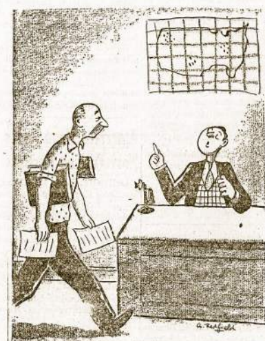
Fabrikantas: "Ar aš tau nesakiau, jog kaip tik darbininkai susirašys į uniją, taip greitai jie pamirš kiek daug gero mes esame jiems padarę!"

LLD 15-tos Apskrities (Tąsa 5-tam pusl.)