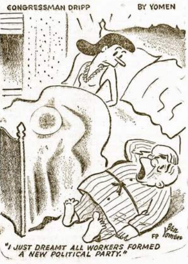
"I JUST DREAMT ALL WORKERS FORMED A NEW POLITICAL PARTY."