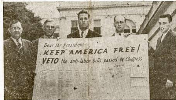
Gigantiškais 40.000 parašų laiškas prezidentui Trumanui, kurį Dayton, Ohio, uništai išsiuntė į Washingtoną. Laiskas protestuoją prieš Taft-Hartley planą ir reikalauja vetuoti jį.

Ir paties instituto išvadamis jie yra Stalinis, Curie, Blumas ir De Gaulle. Curie, žinomas mokslininkas, yra komunistas. De Gaulle presyžas greit krinta, lygiai kaip Blumo.