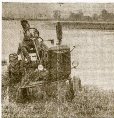
Minnesota's farmers įklimps šlapioje dirvoje su traktorium. Nepaprastai lietingas pavasaris ne tik nedaleido daugelio valstijų fermerius laiku užėti laukus, bet grumoja ir žiemkenčių pasėlims.

Nekrasovo poezijos poveikio reikėty taip pat paieškoti ir V. Kudirkos, Mačio-Kėkšto, Jovaro, J. Janonio kūryboje. Tas poveikis nebūtinai visada čia bus atskamas tiesioginiais sutapimais, akivaizdžiais sekimais ar pasiskolinimais. Daug daugiau lietuvių poeziją Nekrasovas yra veikęs bendrąja savo kūrybos idėjine linkme, savo poezijos kovingu patosu, savo giliu lyriskumu ir tautiškimu, savo kalbinių elementų liaudiskumu, savo formos