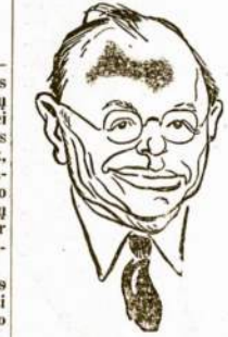
SENATORIUS R. TAFT