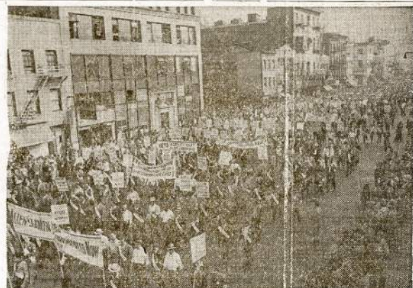
200,000 newyorkiečių unijistų maršavo gatvėm po 16 eilėje per 4 ir pusę valandos CIO suruoštoje demonstracijoje prieš Tafto-Hartley bilijū.

Minimoji knyga-almanakas gali būti perkama "Vilnius" raštinėje. Ji yra idomus skaitymu ir informacijos šaltinis kiekvienam, kuris domisi brolių lietuvių gyvenimu Pietų Amerikoje.