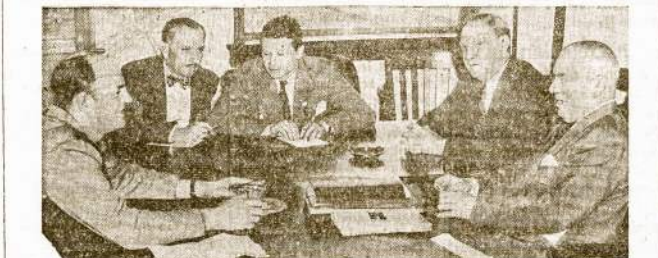
Jūrininkų unijos (CIO) prezidentas Joseph Curran (kairėje) tariasi su laivų kompanijų atstovais ir federalės valdžios tarpininkais jūrininkų streiko reikalu. Derybos buvo paskėmingos ir unija didžiūmą reikalavimų laimėjo.