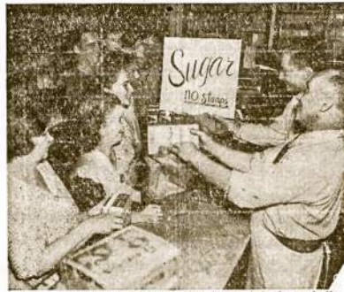
Ir krautuvinkas, ir šeiminkės linksmi, kada paskelbtas galas racionaliui cukraus. Cukrus dabar jau par-davojamas be racionaliū kopuon, nors ant kainų kon-trole dar bus palaikyta tūla laiką.

Grįždami namo sustojom gražiame kabarete. Ten taip gražu ir įdomu, net ma-lonu sėdėti. Vakarinė pro-grama labai graži. Pora so-ko. Paskiau jauna akrobata lankstėsi, vartėsi, tarsi ji be jokio kaulo. Ant galo išėina ant estrados, baltame vaka-ro rube, graži dainininkė. Pasileidžia iš jos vyšnialų lūpų nepaprastai gražus balsas. Jos dainos posmai lyg siūbuote siūbuoja ir pa-gavę klausovą traukia prie