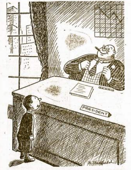
Fabrikantas: "Taip, darbo jėga mums labai reikalinga ir satinku pasamdyti. Bet patiriu, jei nori prasiekti iki tokio laipsnio kaip aš, turi šaltinis nuo unijistų ir prie kiekvienos progos keikti unijas susriedamas."