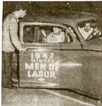
Californijos unijntų automobilų kalvaras kelyje į Washingtoną užprotestuoti prieš Tafto-Hartley bilij. Prie kaliforniečių pakeljo prisidėjo kitų miestų unijntai ir kartu išleido galimą daug žmonių protestą prieš Kongreso pasikėsimą suvaržyti žmonių teises.

PEORIA, Ill.—Rytinišs šio miesto dalies policija eina per stulbas ieškodami, kas pavogė namą. Earl Allen raportavęs policijai, kad jo dviejų aukštų prefabrikuotas namas pavogtas.