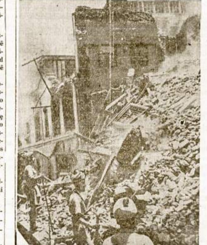
Šis Indijos miestas atrodė kaip bomby sunaikintas karo metu. Tai nuotrauka tuoj po įvykių riaušių tarpe indų ir mahometonų. Prie riaušių gyventojus kurole tam tikri interesai, kurie norėjo palikyti britų kontrolę Indijoje dar kitus 300 metų. Juo daugiau Indijos gyventojai kelia savitarpines riaušes, tuo lengviau yra kam nors juos valdyti.

Maskvos. Vidurinės mergaičių mokyklos Nr. 76 mokinės kvietimą mieliai priėmė. Tam reikalui buvo panaudotos žiemos atostogos. Koks nepaprastai šiltas ir nuosirdus buvo neakivaizdinių draugų ir draugu susitikimas. Maskvietės pavietė mūsų didžiosios Tėvynės sostinėje, tiek Lietuvos mokyklose.