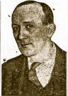
William Z. Foster

Užgirsim svarbių kalbų, kurias pasakys A. M. Komunistų Partijos pirmininkas Wm. Z. Fosteris ir kiti žymūs kalbotojai bei visuomeninkai. Dabar esame visų susirūpinę dėl praveisto anti-darbininkiško biiliaus.