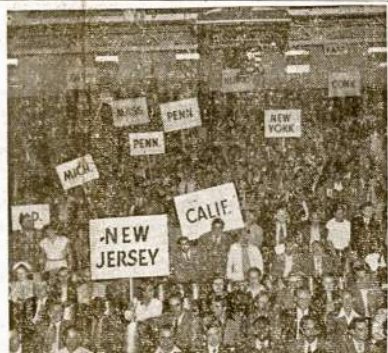
Unijū delegacijos iš įvairių valstijų laiko masinį mitingū-demonstracijū Washingtonė. Jie čia buvo sužadėvū užprotestuoti prieš Tafto-Hartley bilijū. Prezidentas paklausė masių balsū ir bilijū buvo vėlavęs, bet Kongrese vėlo atmetas didžiama balsū ir bilijū jau tapato įstatymū.