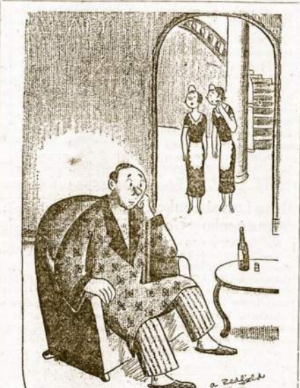
Tarnaitė: "Vargšelis tas mūsų ponas, jis visą savaitę negalėjo užmigti kai sužinojo, jog Kongrese jo draugai nepajėgė paneigti prezidento veto ir nesumažino jo mokesčius nei ant šimto tūkstančių dolerių."