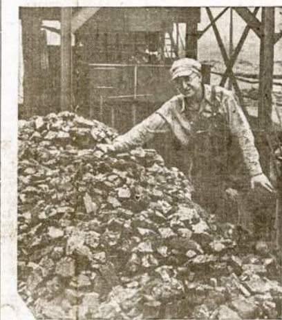
Centralia angliakasis pradeda dirbti kasykloje, kurioje kovo mėnesį žuvo 111 darbininkų. Šioji kasykla, po trijų mėnesių visoki "inspekciją" pripažinta ir vėl saugi. Bet tik trijų dienom vėliaus kitoje kasykloje. West Frankforte, panašioje katastrofoje žuvo kiti 27 mainie-riai. Ir šioji kasykla kompanijos buvo pripažinta "saugi".

Kas tai—manevrai, ar gerini-masis Tarybų Sąjungai? L. Prūseika.