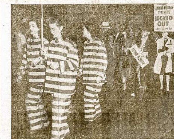
Sekių mokyklos mokytojos pikietuoja Arthur Murray įstaig New Yorke apsirėdžius kalinių kostumais. Užpakalyje pikietė atvaizduojamas pats įstaigos savininkas charakteryje "Simon Legree." Pikietininkės atkreipė atydą didelio skaitliaus nevyorkiečių ir tuom suteikė užsispyrusiam savininkui nemažai nemalonių reklamų.

Nedaug žinių gaunam iš Jugoslavijos, bet kurias gaunam, kelia mūsų akyse tos šalies reputaciją.