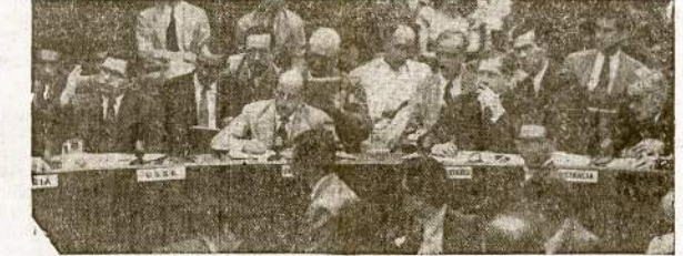
Gremyko, TSRS atstovas, vetuoja Jungtinių Tautų Organizacijoje Saugumo Taryboje Amerikos planą įsteigti visagalę komisiją, kuri Balkanuose neiškaitytų su šaliu suverenetu.