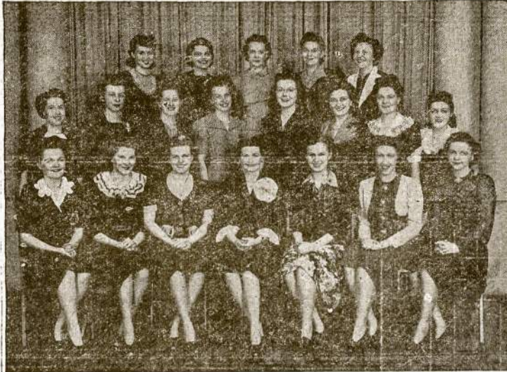
Above is pictured a portion of Chicago's Lambda Delta Sigma (LDS) sorority group who last week gave a cash donation toward the Al Blozis Chapter American Veterans Committee building fund. (See story below.)