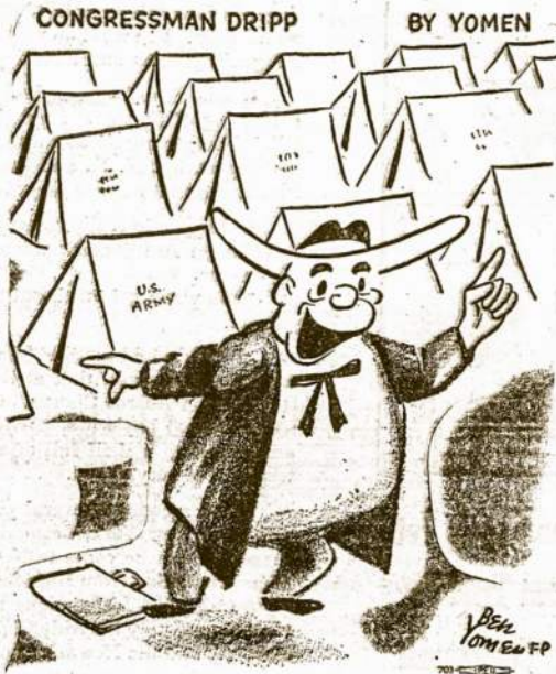
AND DOESN'T THIS PROVE I FAVOR HOUSING FOR VETERANS?!

Miksis and Al Gionfriddo are the best six left fielders in the business. Ralph Branca, Harry Taylor, Joe Hatten, Ric Lombardi and the others the outstanding pitchers. Bruce Edwards is a wonderful catcher. Burt Shotton is a great manager. Ebbsen Field is a garden spot of America.