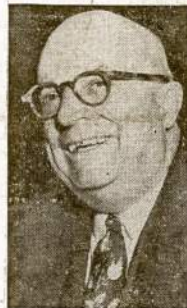
Henry Kaiser, laivų statytojas, daug pasidaravęs karo metu už pergale. Republikonai dabar bando jį įvyelti ir nesėdury machinacijų ir kyšų tyrinėjimą.

ORAS Giedra, šiek tiek šilčiau, numatoma temperatūra 87°. Saule teka 5:15, leidžiasi 8:01.