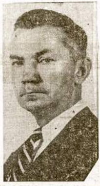
Naujas krašto apsaugos sekretorius Forestall. Prieš karą jis buvo vokiečių IG Farben Amerikos subsidinės firmos viceprezidentas.

BARROW (Alaska).—Generalas Eisenhoweris lankėsi vakar šia. Ši vieta randasi prie pat šiaurinio pogrando.