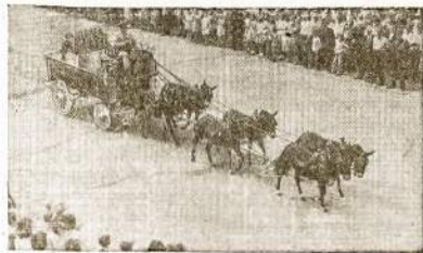
Čia matome nykštukų asilų rinktinę

Vienas iš įdomiausių asilų rinkinių pastaruoju laiku paroduoja Chicagoje. Kaip aukščia matote, net šeši mažičiai — „nykštukai“ asilukai veža ratus pritaikintus jų dydžiui. Ši nykštukų asilų rinktinė važinėja po visą šalį pastangomis Peter Fox Brewing Company, kuri išdirba Fox De Luxe alų.