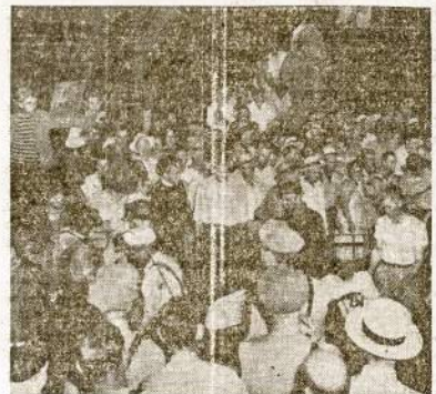
Minios mainierij ir žuvusių šeimų bei artimieji susirinkę prie kasyklos laukia iškeliant lavonų West Frankforte. Eksplozijoje žuvo 27 darbininkai.

RANGONAS.—Burmės valdžia pranešė, kad buvęs premieras U Saw bus teisiama kaip atsakomingas už 7 kabineto ministrų nužudymų liepos 19-tą.