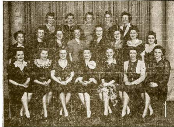
Chicago Lambda Delta Sigma Sorority, jaunų moterų ir merginų. LDS narių organizacija, paskutiniam savo susirinkimui nutarė skirti $189,000 veteranų organizacijai, Al Blozis Chapter of the American Veterans Committee, namo (dubuo) įsteigimui fondai. Pinigai buvo sukelti, kad karo metu minčia organizacija rengdavo parengimus ir pelnu pirkdavo kariams (LDS nariams) dovanas ir siūsdavo į karo frontą. Dabar likęs fondas liko paskirtas kariams grįžusiems iš fronto, kad padėjus sukelti reikiamą sumą savo namo įsteigimui.