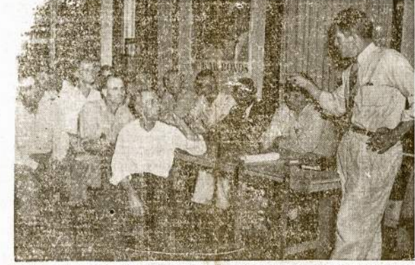
Tennessee fermeriai susipažsta su kita didele šalies gyventojų—darbininkais ir jų problemom. Kada Tennessee fermerių unija ir likę savo konvenciją Montegae, Tenn., tai jie pasivikiė atstovus iš CIO, AFL ir geležinkeliečių brolijų ir ištisias 5 dienas klausėsi prelektėjų. Svarbiausia tema—fermerių ir darbininkų vienybė.