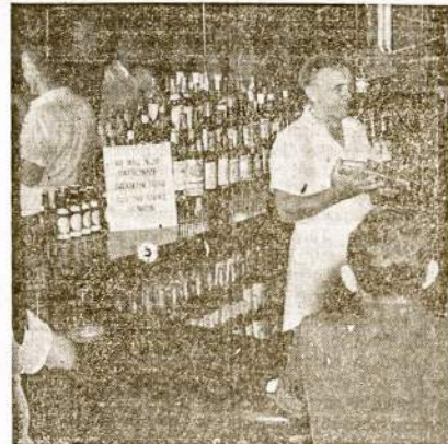
Kada Brooklyno banko darbininkai streikavo, apylinkės biznieriis išstātė iškasbas savo įstaigose, kad iki trustas neišpildys darbininkų (CIO) reikalavimo, jie nedarys jokio biznio su banku. Matant tokį solidarumą, bankinis trustas turėjo susitaikyti su unija.

Northwestern Universitete įvyks astronomų konvencija, rugsėjo 3-7 dd. Tikimasi, kad toje konvencijoje bus kas nors naujo ir svarbaus pravesta.