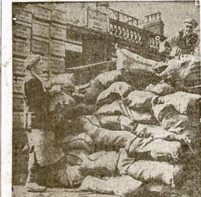
Štai Anglijos "socialistinės" vyriausybės gospadoriavimo pasekmės: didžiausi sandėliai maisto—vaisių ir daržovių supūdyti. Sugadintas maistas išvežamas į laukus ir bus apardas, kad užrėšti dirvą. Tuom tarpu "socialistinė" valdžia gvolto šaukia, kad Anglijoje jau beveik badas. Maistas ten supūdytas—kaip tai dažnai padaroma Amerikoje—kad palaikyti aukštas kainas.