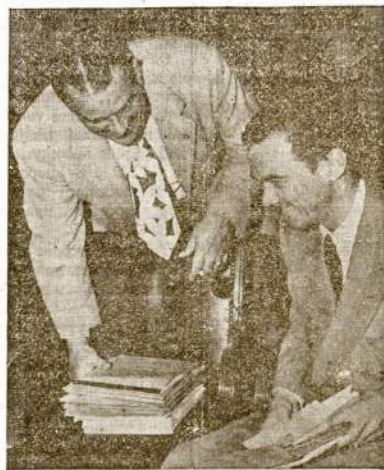
Lektuvų fabrikantas Howard Hughes, prigėlbint jo privatiškam gynėjui, susirenka dokumentus Senato investicijos kambarje prieš aplesiant Washingtoną. Hughes'o tyrinėjimas nuėjo taip toli "iš vėžių", kad grąsino iškelti darbelių dar didesnį fabrikantų, kurie neskupėjo "pamylėti" aukštus valdininkus laike karo, kad gauti riebių kontraktų iš valdžios.

Daugeliui moterų tai buvo "Ašarų Miestas," daugeliui vyrų taip pat, bet kai kam buvo ir džiaugsmo miestas, nes yra žmonių, kurie tikrai negali sugyventi ir kada negalima persiskirti, jie mizernai gyvena.