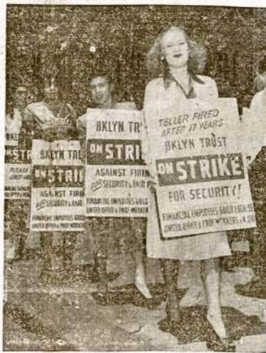
New York Broadway'aus teatro artistės pagelbsti pikietuoti Brooklyn Trust kompanijos banką, kurio darbininkai streikuoja už aukštesnes algas ir žmoniškesnes darbo sąlygas. Streikieriai yra nariai CIO unijos, o čia pikietuotojų artistės vaidina Broadway teatre dramoje "Finian's Rainbow".

Šilta ir tvanku. Numatoma 96 laipsnių temperatūra.