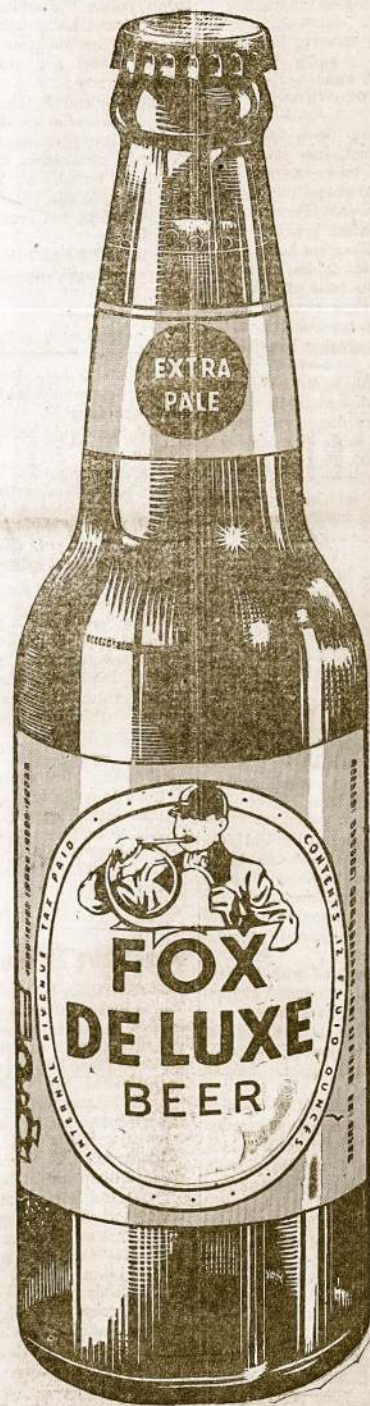
Fox De Luxe Breweries of Chicago, Grand Rapids, Marion, Ind., and Oklahoma City

Sumaišytas su Importuotais Iš Bohemijos Apyniais Geresniam Skoniui ...Geresnis Alus