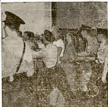
Grįžta "senieji laikai" Michigane. Štai buožem apsiginklavę policistai daug galvas streikieriams prie Chevrolet dirbtuvės Highland Parke (Detroito priemiestyje). Sumuštus streikierius policija nuvežė kalėjimam apkalintama "kėlime betvarkės."

WASHINGTONAS.—Pirmos klasės geležkio kompanijų pelnai žymiai pakilo šiomet. Per liepos mėnesį padaryta $37,000,000, pernai tuo laikui buvo daug mažiau.