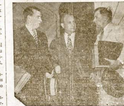
Amerikos kongresmanai išvyksta Europon susipažinti su pokariniu problemom. Jie yra užsienio reikalų komisijos nariai, skaitant iš kairės: James G. Fulton (Pa.), Jacob J. Javits (N. Y.), ir Frank Chelf (Ky.).