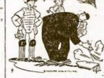
Tu pamatytum, kas KEN'S KLUBE ant lekkių!