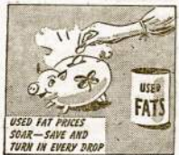
USED FAT PIESCES SOAR—SAVE AND TURN IN EVERY DROP

Tie, kurie daugiau deklamuoja apie laisvę žodžio, slopinia jį. Rochesteriečių pareiga—grąžinti Wallace'ui jo teises ir griežtai pasmerkti inkviziciją.