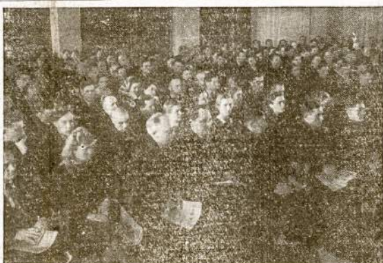
Lietuvos TSR Aukščiausiosios Tarybos Seimo sesija, sostinėje Vilniuje. Atstovai suvažiavę iš visos Lietuvos čionai svarsto Respublikos reikalus.

ALBANY, N. Y.—Aspirantas į republikonų prezidentinį kandidatą Thomas Dewey, ilgai tyteljės visais svarbiais klausimais, pagaliau prabilo, kad jis stojos už Palestinos padalinimą į dvi.