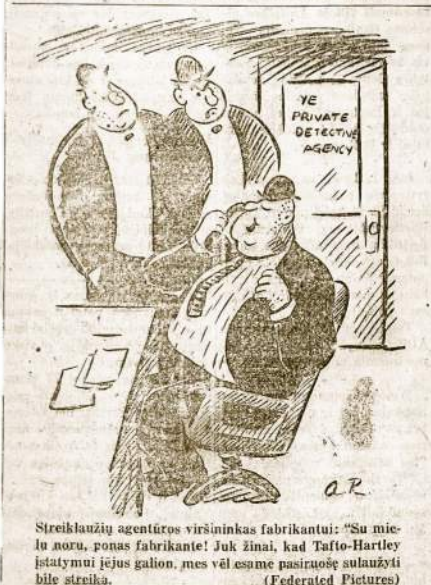
Streiklausių agentūros viršininkas fabrikantui: „Su mielu noru, ponas fabrikante! Juk žinai, kad Tafto-Hartley įstatymai jus galion, mes vėl esame pasirengę sulaužyti bile streiką.“

Mielas Dėde! Gaves laišką nuo jūsų tuojau rašau keletą žodžių, kadangi esu labai jūsų pasiilgęs. Visą laiką galvoju,