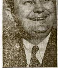
Kongresmanas Wright Patman, Texas demokratas. Jis anadien pareiškė, kad republikonai užsi-puolė ant kooperatyvų judėjimo ir handys apsaukti jį "komunis-tiniu" ir "užsieniškū", kad at-baidyti nuo kooperacijos tiki-ninkus ir miestų vartotojus.

KINIJŲ DINGO POPIERINIŲ PINGŲ $48,000,000,000