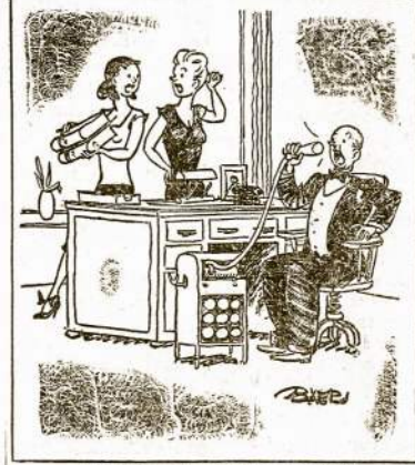
"This is his week to be Gabriel Heatter."