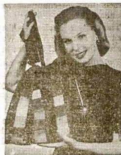
IT'S IN THE BAG—Big enough to suit milady's needs is this draw-string reversible carryall of navy blue, with multi-colored wool inserts.

Police were called and Henry paid $50 and costs on a charge of assault and battery and was sent to jail for 60 days.