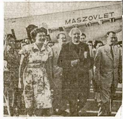
Garsusis Anglikonų bažnyčios dvasininkas Hewlett Johnson iškilmingai sutinkamas aerodrome Budapešte, kada jis neseni lankėsi Vengrijoje.

Sovietų spauda taigpi sako, kad Brazilijoj atlaikyta konferencija irgi buvo Amerikos planas susiorganizuoti Lotynų Amerikos valstybes tam tikslui, kad užsimotai valdyti Jungtines Tautas.