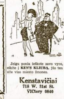
Jeigu ponis išlektose savo vyro, tai elicite į KEN'S KLUBA, jės ten rasite viso miesto žmones.