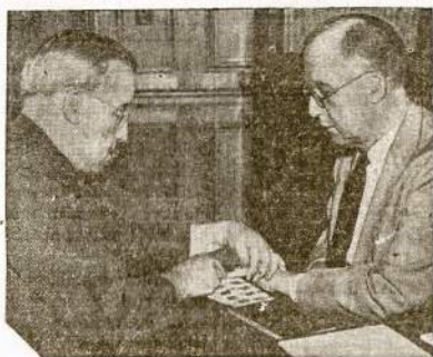
Darbo Sekretorius Lewis B. Schwellenbach (dešinėje) duodasi ntraukti pirštų nuospaudas po kaip ir jis išplėdė "lojalumo katekizmą", kurio reikalauja ragany gaudymo įstatymas. Aisku, Schwellenbach dėl to nebus terorizuojamas, bet tūkstankiai valdžios darbininkų turės perėti viduramžių inkvizicijos tyrinėjimus, kad įrodyti savo lojalumą šiai šaliai.

Nedėlioį, rugsėjo 28 d., įvyks Apskritis konferencija Croatų svet., 798 Grant st., Akron, Ohio. Visi Cleve-