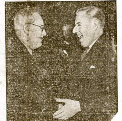
Tarybų Sąjungos delegatas Andrei Višinskis sveikinasi su Britanijos delegatu Hector McNeil pertraukio sesijos Jungtinių Tautų Asamblėjoje. Tuoj po to McNeil pasakė prakalbą, kurioje baurian išpludo Tarybų Sąjungą ir jos atstovą Višinskį.