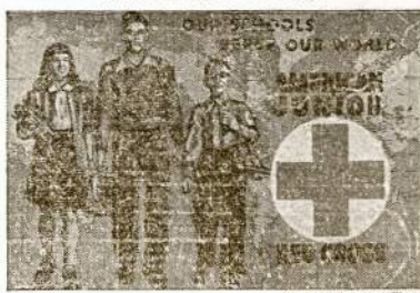
More than 15,000,000 Junior Red Cross members in U. S. elementary and secondary schools serve their communities, their country, and their world. This year's program highlights educational rehabilitation abroad and aid to convalescent children in this country. This 1947-48 enrollment poster is the work of the artist William A. Smith of New York City and Toledo, O.