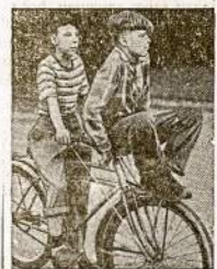
Youngsters who do this on a bicycle built for one are not letting accident sneak up on them. They are out to meet them head-on, says the American Red Cross.