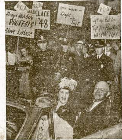
Seattle, Wash., unijstai pasitinka senatorių Taftų su protesto demonstracija. Jo republikonai frontai taip greitai skubino nušvežti senatorių iš stoties į svetainę, kad automobilio durim sunkiai sužeidė Tafto ranką.