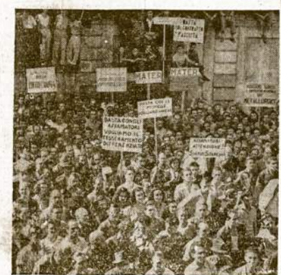
Italijos sostinės Romos valkai stoji bendrai su tėvais protesto demonstracijon prieš aukštas maisto kainas. Išskaito ir kitokie šūkliai ir protestai. Tokios demonstracijos Italijoje klio daugelyj didmiešiej. Reikalaujama premiero De Gasperio valdžios numazinti maisto kainas.

BUENOS AIRES, Argentina.—Streikas 12,000 uostų darbi-