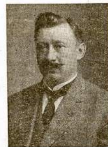
Kompozitorius MIKAS PETRAUSKAS