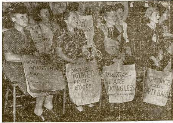
New Yorko šeimininkės su tokiomis krepšiais, į kurias dedama nupirktas maistas, taip su sūkais ant jų krepšius, suėjo į maisto kainų kilimo apklaušinėjimą, kuris vedamas respublikonų kongresinės komisijos. Darbininkai atstovai ir šeimininkės nurodė, kad kuomet maisto kainos nesvietikiai kyla, maisto spekuliantai kraunasi labai didelius pelnus, ir reikalavo mažinti kainas.