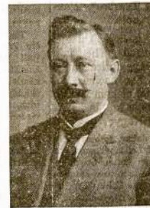
Kompozitorius MIKAS PETRAUSKAS