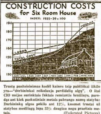
Trustų pasiteisinimas kodėl kainos taip pašėliškai išliko yra—"darbininkai reikalauja perdidelių algų". O štai CIO unijos surinktais faktais remiantis braizynas, parodantis ant kiek pastatinius metais prabango namų statyba: Darbininkų algos pakilo ant 12%, kuomet trustai už statybos medžiagą lupa 33% daugiau negu praeitais metais.

Pittsburgho vengrų dešiniųjų organizacijų surengtame masiniame mitinge rugsėjo 7-tą kalbėjo Nagy. Kartu su juo kalbėjo nuo tos pačios platformos kitas vengras pabėgėlis, tūlas Tibor Eckhardt. Kas tas Eckhardt? Pasirodo, kad Eckhardt jau 1920-tais metais Budapešte suorganizavo grupę po vardu "Ebredu Magyarok Egysulete" ("Atbandantieji Vengrų Sąjungai"), kurios fasizmas tada buvo aiškus, ir buvo viena pirmųjų fašistinių organizacijų Europoje. Tais metais Eckhardt davė sekamą pareiškimą apie savo organizacijos tikslus britų unijntųjų komisijai, kuri lankėsi Budapešte: