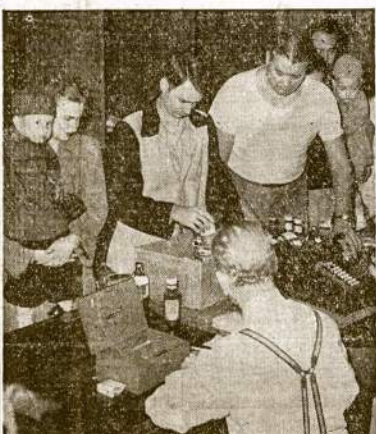
Automobilistų unijos (CIO) lokalo 400 kooperatyvė maisto- kratuvė Detroito priemiestyje Highland Park. Ati- dariusis krautuvė nereikiėjo nei reklamos: joje pirkėjų randasi daugiau negu reikia. Mat unija parodo maistą be pelno.

KANSAS CITY, sp. 8.—Čia mirė G. Hodges, buvęs Kansas valstijos gubernatorius.