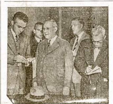
AFL prezidentas Green atskatinėja laikraščių korespondentams į klausimus apie ką jis kalbėjosi su Trumanu, Green pareiškė, kad aukštos kainos ant reikmenų palikomos tiksliai fabrikantams susitarus apribuoti gamybą.