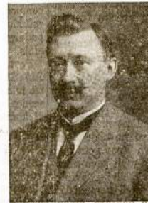
Kompozitorius MIKAS PETRAUSKAS