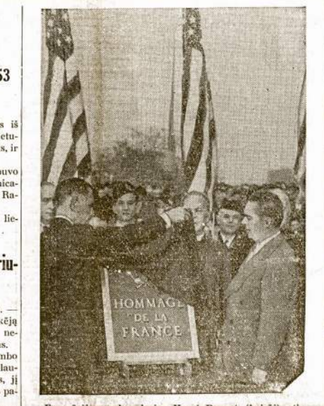
Francūzijos ambasadorius Henri Bonnet (kairė) atidengia New Yorke francūzų liaudies paukoto paminklą atminčiai 6,000,000 žydų, nekaltai išudyty laike nacių siautėjimo Europoje. Dešinėje stovi New Yorko majoras O'Dwyer.