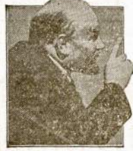
Nicolai I. Leninas

Šis Rusijos revoliucijos įvykis kapitalistinėm pasauliu buvo lyg perkūno trenksmas iš giedros padangės. Tatai įvarė daug baimės, kad toks Rusijos darbininkų revoliucinis laimėjimas gali būti užkrečiamu pavyzdžiu Vakarų Europos darbininkams ir kare-