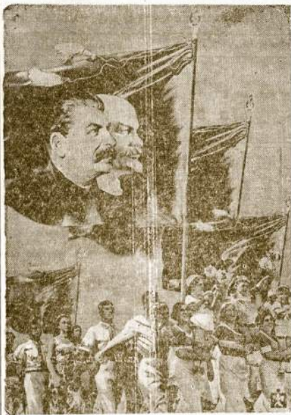
Raudonasis Spalis, 1917, kuomet Petrogrado proletariatas iškėlė pergalingas vėliavas, kuomet po plačią Rusiją nuaidėjo valstiečių šūkis "Laisvės ir Zemės!" kuomet fronto apkausose nusivylę, nuvarę kariai metė šautuvus ir pasileido link savo kaimų; kuomet tos istorinės dienos sudrebrino pasaulį nuo kampo iki kampo, po Leninas, kalbėdamas nūriame fabriko kieme darbinukų mitingui sakė: