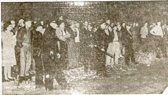
Galion, Ohio, CIO uništai masiniu pikietavimu priverė elektros kompaniją skaitytis su unija ir streiką pilnai laimėjo. Pikietininkai kelias dienas buvo apsupę įmonę ir neleidė streiklaužyti. Tiek misto valdžiai pasisekė praveisti derybas ir paskelbta "paliaubos", kad skebai galėtų aplėsti dirbtuvę. Jie po to nebeįėjo streiklaužiant.

Būsiantį kartą dar geriau sutvarkys dalykus. Darbininkas.