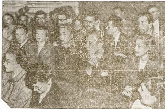
Judžių žvaigždės aplaushinėjami nemerkinio komieto Washington. Atvaizde matosi, užpakalinė eilėj Danny Kay, Eve'ya Keyes, June Havoc, Humphrey Bogart ir jo žmona Laurel Bacall.