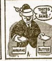
Use margarine in place of butter; much margarine is made from vegetable oils. It also saves money on your food bills.