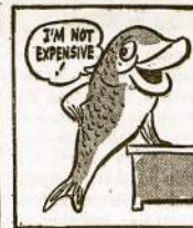
Serve more fish; it's one protein food not dependent on the grain crop; it's delicious breakfast, lunch and dinner.