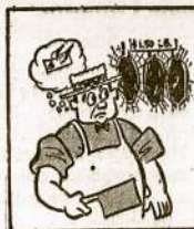
Use lower grades (less expensive) cuts of meat; these have less waste fat and require less grain feeds to produce them.