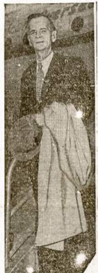
Vokiečių menšvių vadas Kurt Schumaker. Jis dabar vieši šioj šalyj ir dalyvauja AFL konvencijoje kaip broliškasis delegatas.