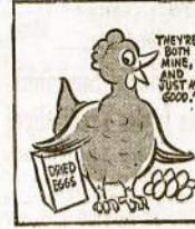
Make use of dried eggs; they're plentiful and convenient for egg dishes and other food preparation.