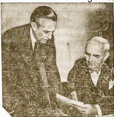
Komercijos sekretorius W. Harriman ir Michigano senatorius A. Vandenberg tariasi apie pagalbą Vakarų Europai. Didžiarsias jų rūpestis esąs, kad nei krisletis to pagalbos nepateiktų žmonėms, kurie dar nėra nustatyti prieš Tarybų Sąjungą.