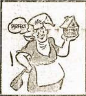
Use cottage cheese in omelets and salads as a main protein dish; avoid to substitute for meat in sandwich fillings.