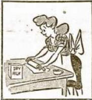
Use dried skim milk. It's available and economical. It's convenient for baking, milk soups and hot milk drinks.