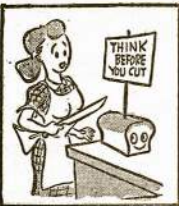
Avoid bread wastes don't overcut; keep bread in refrigerator to prevent mold; don't cut more than needed.

Kongresmanas "at large", nuo visos valstijos nebus renkamas. Tai pirmas distriktų ribų pakeitimas nuo 1901 metų.