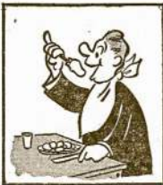
Substitute potatoes for grain products in stuffings, meat extenders, casseroles, in place of bread, bread crumbs, spaghetti.