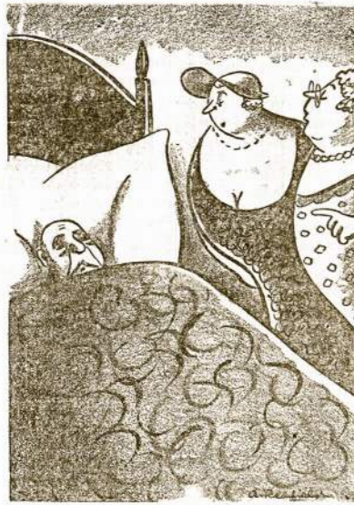
Fabrikanto žmona: "Vargšelis tas mano vyras! Jis taip pavojingai apsigro tą pačią dieną kaip keli jo bičiuliai iš I. G. Farbenindustries tapo pačiūpti Vokietijoje."