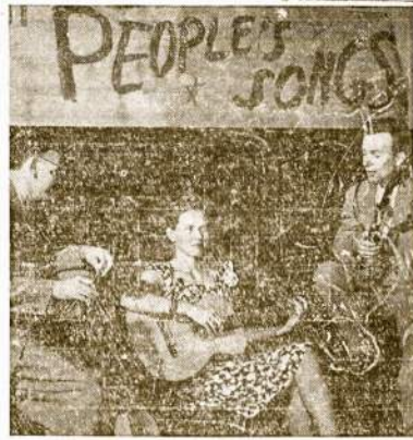
Amerikos Liaudies Dainų mėgėjų pirmas sąskridis, nesenai įvykęs Chicagoje. Čia matosi žymieji laudies dainininkai Earl Robinson, Hally Wood ir Pete Seeger.