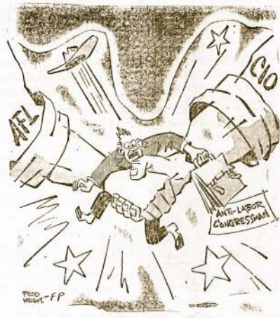
Kada APL ir CIO organizuoti darbininkai suners rankas, tai nei vienas žmonių priešas nebeapsis ir aukštą valdžios vietą. Tu siekia visa pažangioji Amerika.

Minia apgulius Lenino mauzoliejų ir visų lūpos šioje didelėje sostinės šventėje mini Leniną. Minia kriepiasi į jį, lyg jis būtų gyvas. Taip, Leninas gyvas. Tą žino kiekviena tarybinė širdis.