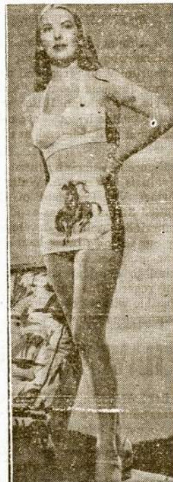
KING IS LEG QUEEN — Lanky Andrea King has been called the "best-legged" gal in Hollywood. A careful examination by VES leg connoisseur indicates there are plenty of reasons for the title. Don't you agree?

cover of methods of doing this has been only a question of time.