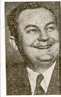
Kongresmanas Wright Patman užprotavosia Kongrese prieš pasimojimą suakinėti kooperatyvų judėjimą. Vietoj to, jis sako, reiktų paimti už pakarpus Amerikos fašistus, kurie vis drąsiau pradeda pasirodyti.