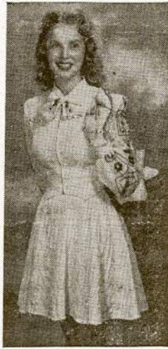
Film starlet Janet Leigh proves that women can wear sport clothes and still get men to stop and stare. This particular getup is a skating costume cut above the knees to provide freedom for fancy capers.

CHICAGO:—Santa Claus has arrived in town — the constant reminder of how many shopping days one has before the Holidays already puts one in that Xmas spirit. Following Christmas, one is reminded of eggnog and strains of Old Lang Syne.