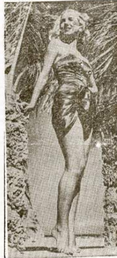
LOOK HERE—It had to come sooner or later, the new look swim suit, and it appears to have been waiting for. Made of elasticized satin, it should keep the beaches crowded this summer.

Well it's all over now. You all know who Miss Hush is. And the winner of Radio's Greatest Contest, the Texas housewife, certainly will get an array of prizes. It would be nice if all was hers, but after the small item of tax is paid, it's certain that the unfortunate losers will have little to regret.