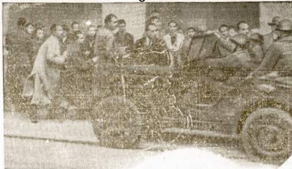
Neliesioginai ir Amerika prisidėjo prie lauzmo Italijos darbininkų streiko. Štai Amerikoje gamintu "džypu" kareiviai ardo pikieto eiles Romoje. Streiką uždarė darbininkai laimėjo, valdžia buvo priversta apriboti bei darbius ir pakelti dirbančiųjų algas. Kitose Italijos srityse streikas dar tęsiasi.

geriausiai pasirodė Cudahy kuopa. Ypatingai svarbu pažymėti, kad ten gauta naujų narių, kur mažiausiai lietuvių gyvena. Prisiminus apie spaudos veikalus ir "Vilnius" vedamą vajų sustiprinimui "Vilnius" finansiniai, iš LLD 8-tos Apskritis išdo paaukauta $50.00 ir delegatai sudejo kitą $50.00, taip kad Wisconsin draugai prisidėjo su visa šimtaine. Svečias.