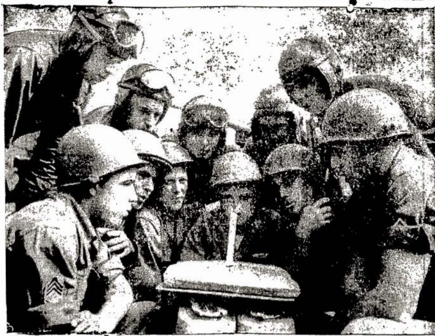
Didžiū susidomėjimu ir viltim Amerikos kariai Korėjoj klausosi radijo pranešimus apie karo pailaubas. Kaip kariai, taip ir visa žmonija trokšta, kad karas būtų greit baigtas ir taika įvykinta.

Tų pačių reaktionierių aiškinimas, kad judėjimas už taiką esąs "komunistų padaras" ir kad "Kremliaus agentai" nori taikos, yra tikslis propaganda sulaikymui taikos judėjimo, įbauginimui žmonių, kad būtų pasyvūs ir nereikalautų taikos. Jei priimti tąjį jų aiškinimą už gryną pinigą, kokia išvada iš to susidaro? Išvada susidaro ta, kad ir Trumanas, ir Ridgway, ir Popiežius, ir didelis skaičius vyskupų ir kunigų, taipgi skaitlingos grupės profesorų, mokslininkų ir meninin-