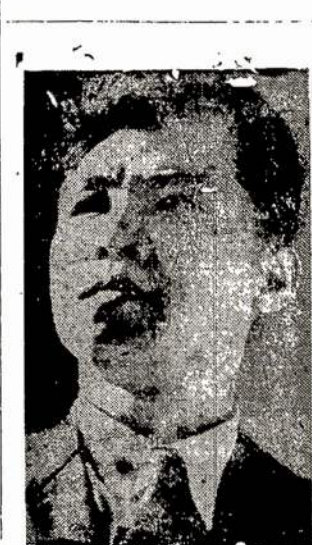
Tai Kum Il Sung, premieras liaudiškosios Korėjos. Tarpe jo ir gen. Ridgway atstovų šiuo metu eina pasitarimai dėl karo paliaubų.