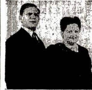
F. ir H. Geldbutai, sav.

Ne vien tik gerimus užlaiko, bet yra draugas ir rėmėjas unijų ir abelnai darbininkų judėjimo.