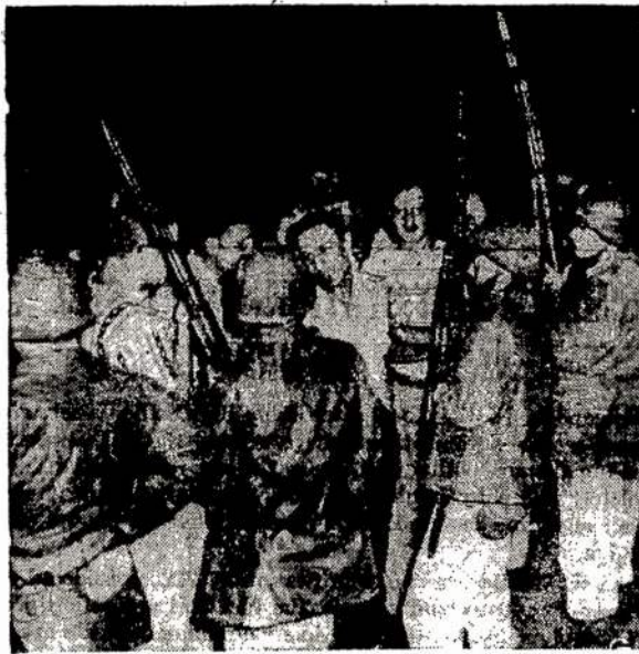
TROOPS FACE ANTI-NEGRO RIOTERS

Mrs. Roosevelt points out that a plan for flood control had previously been advanced by the Army engineers, together with an itemized statement of the total cost of the project. The plan had either been voted down or ignored. She insists: "If you add up the damage done over the period of the last 25 years, we could have spared far more than it would have cost us to carry out the plans."