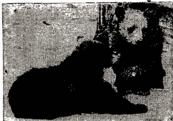
GRIZZLY BEAR CUBS