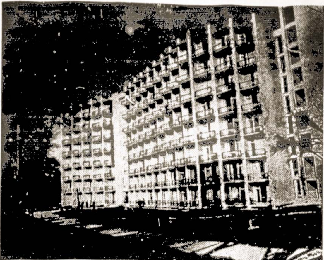
"Vilniaus" sanatorija Druskininkuose.