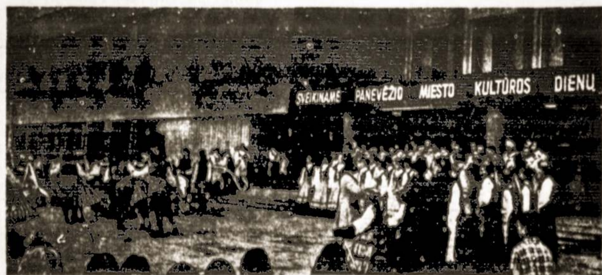
aikštėje prie Kultūros rūmų Ukmergėje koncertuoja Panevėžio „Ekranu“ gamyklos liaudies dainų ir šokių ansamblis.