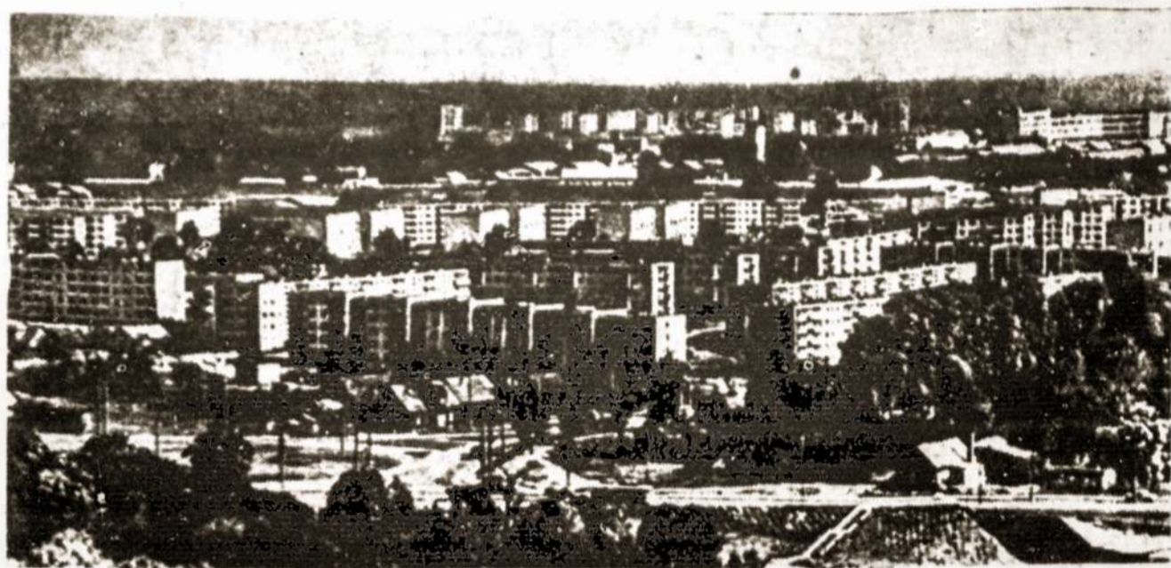
Vilniaus Zirmūnų rajonas.