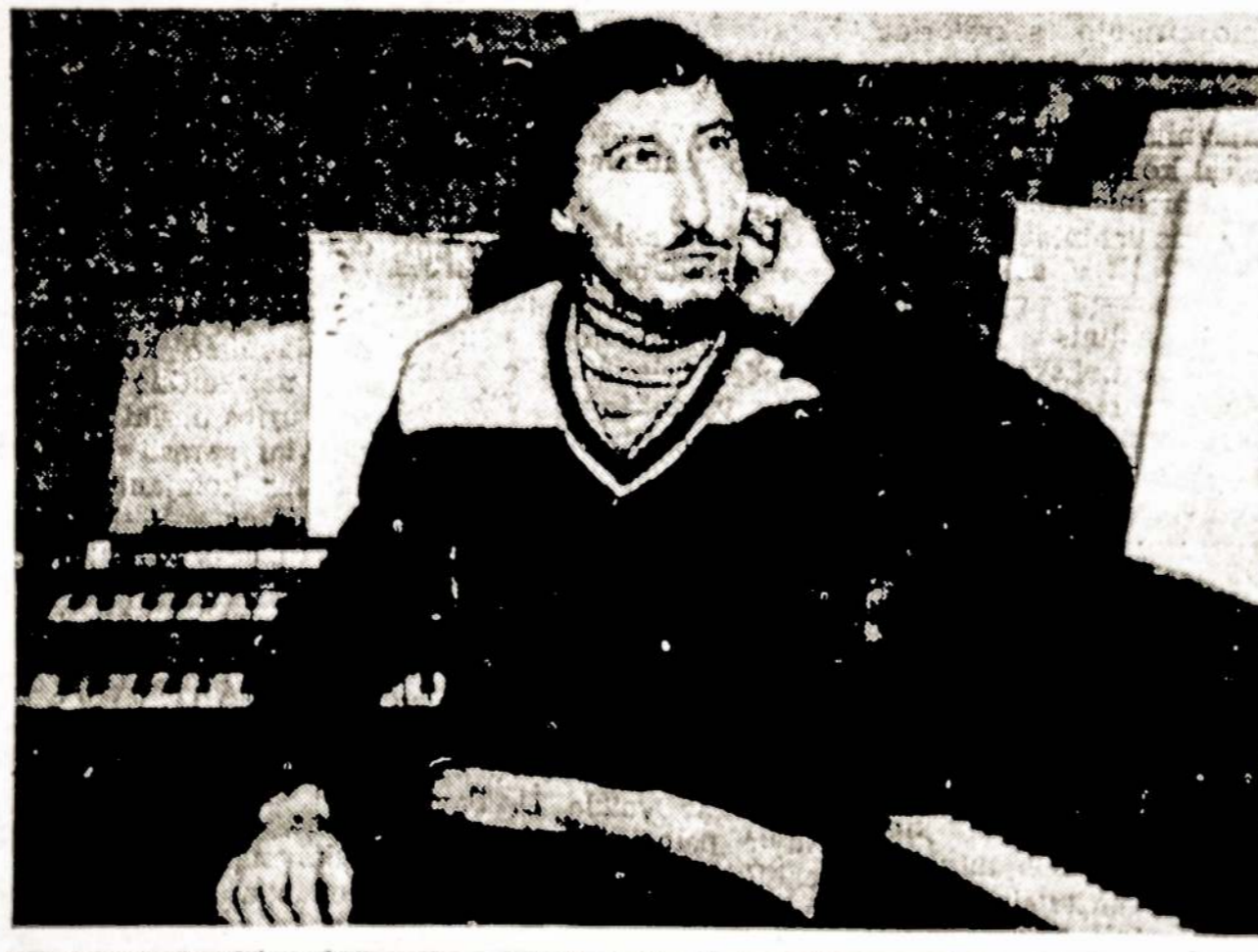
Kompozitorius Giedrius Kuprevičius