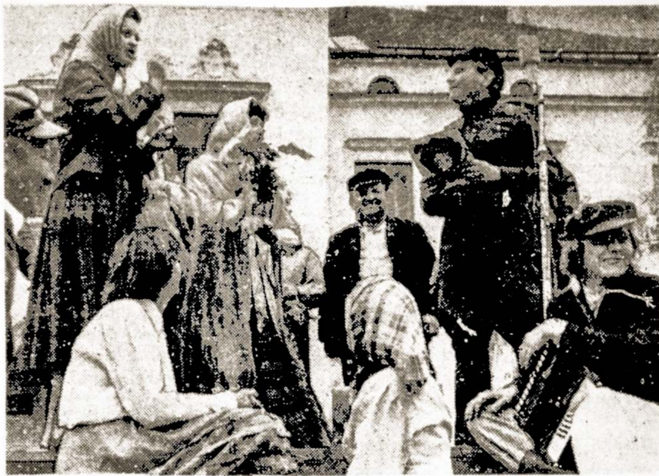
Grazi rokiškėnų tradicija—rengti masinius istorinius vaidinimus, kuriuose dalyvauja šimtai rajono saviveiklininkų ir Liaudies teatro kolektyvas. Toks masinis vaidinimas vyks ir minint Tarybų valdžios atkūrimo Lietuvoje 40-meči.

A. Zibolio nuotraukoje: scena iš vaidinimo "Kalvių žemės ažuolai".